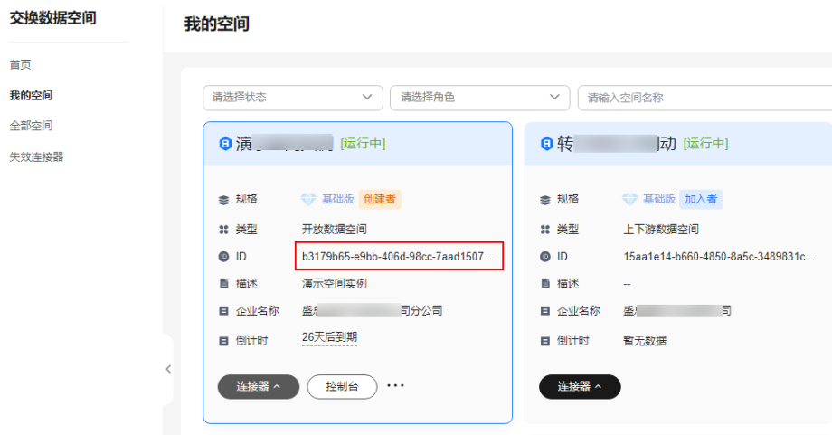
图 6-3 查看实例 ID