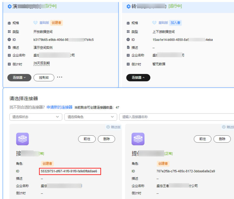
图 6-4 查看连接器 ID