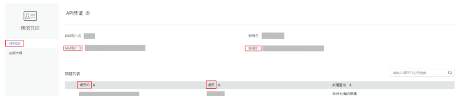
图 6-2 获取账号 ID