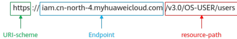
图 3-1 URI 示意图